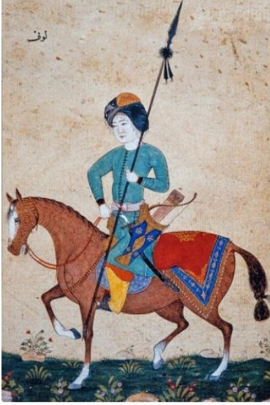
Görsel 3:Levni süvari adlı minyatürü (TSMK, Hazine, Albüm, nr. 2143, vr. 13b)

18.yy'a gelindiğinde dönemin en önemli minyatür ustası Levni görülmektedir. "Levni'nin asıl adı Abdülcelil Çelebidir. Lale Devri'nin canlı eğlence hayatını da canlandırmıştır. O, Lale Devri'nin 15 gün bayramlarını, III. Ahmet'in kızlarının düğünleriyle erkek çocuklarının sünnet düğünlerini, renkli ve hareketli anlatımı içinde yansıtmaktadır. Kişilerin karakteristik özelliklerini başarılı bir şekilde yorumlamıştır. "Vücut hareketleri, ellerin doğru görüntüye uygun çizimleri, Lale Devri'nin Batı'da olan Barok gözleme ne denli yakın olduğunu gösteriyor. Ancak onun resimlerinde Batı etkisinden söz edilemez. Ağaçlar, kuşlar, saksaganlar, zarif hareketler içinde verilmiştir. Ayrıca dikkatli gözlem, bitkilerin deseninde de görülmektedir." (Turani, 2014,667-668).