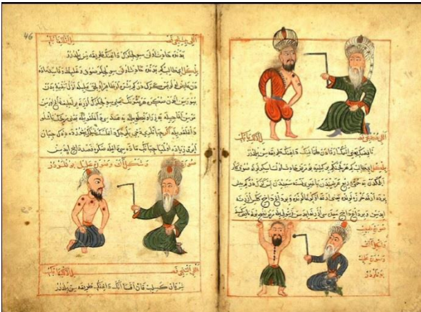
Görsel 2:Cerrahiyeiİlhaniyei kitabından bir kesit

Osmanlı döneminde Fatih Sultan Mehmet’e sunulan Cerrahiyeiİlhaniyei isimli tıp kitabında kullanılan minyatürlerde hastalıkların nasıl tedavi edileceği anlatılmıştır. Bu yüzden figürler basit betimlenmiş konu ise net ve canlı bir yorumlama anlayışıyla aktarılmıştır. Konunun aktarımı ön planda tutulmuştur. Konunun aktarımı ve minyatürün öğreticilik özelliği dikkate alındığı için figürlerin tasvirine çok fazla önem verilmemiştir”(Aslanapa, 2017,369).